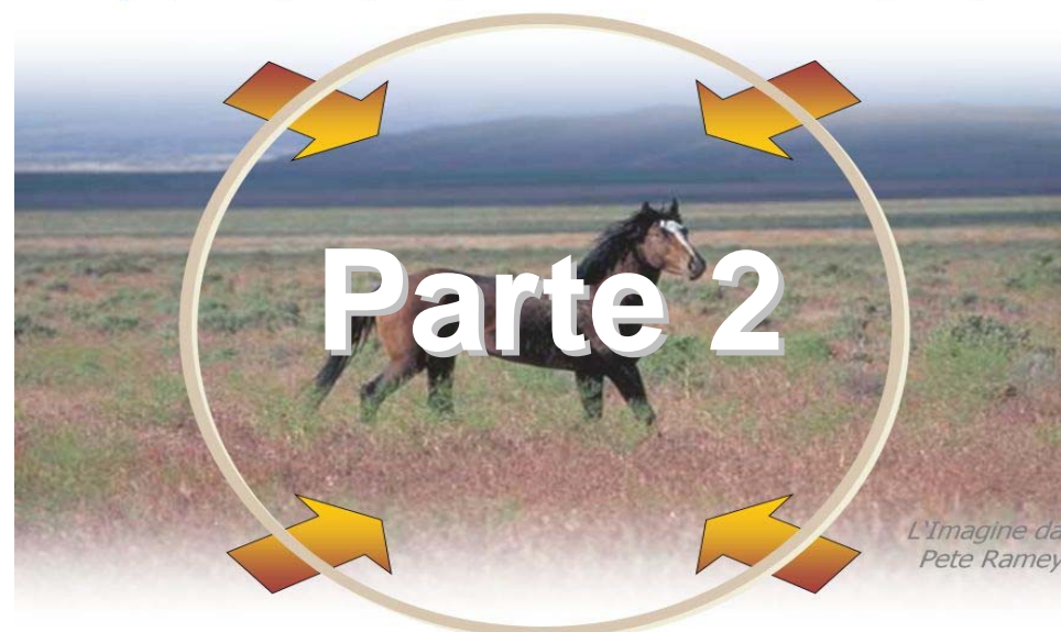
L'immagine da Pete Ramey